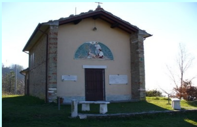
CHIESA CERRETA S. NICOLA