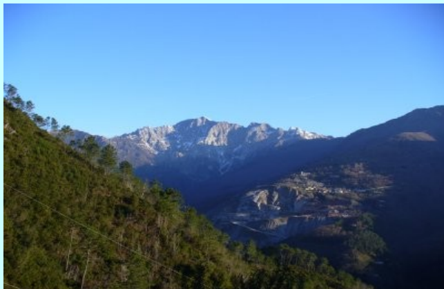
MONTE ALTISSIMO VISTO DAL SENTIERO 140