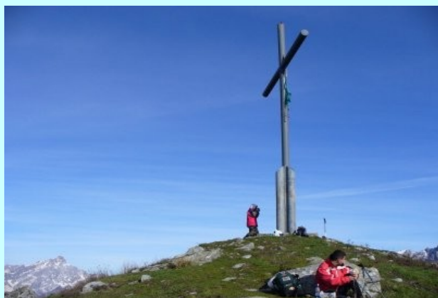
VETTA DEL MONTE FOLGORITO