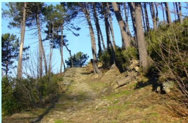
SENTIERO CAI N. 140